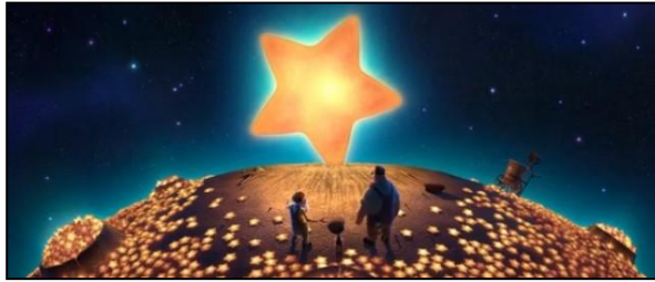
Film 2: La Luna : Ay