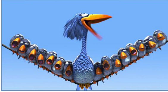
Film 4: For the Birds: Kuşlar İçin